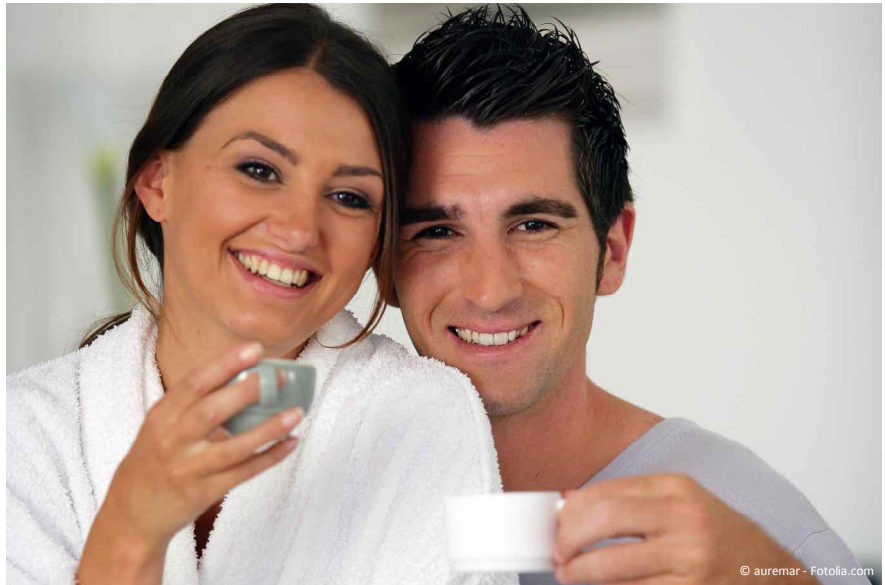
Lückenlos glücklich: Wer heute (z.B. durch einen Unfall) einen Zahn verliert, entscheidet sich meistens für ein Implantat mit Krone. Der Grund ist einfach: Kaum jemand möchte noch, dass gesunde Nachbarzähne für eine Brücke abgeschliffen werden.

Mit einer Zahnlücke kann man auch nicht mehr so gut kauen und abbeißen. Der Kieferknochen baut sich im Bereich der Lücke ab und es entsteht eine Mulde. Einzelne Zähne können beginnen zu