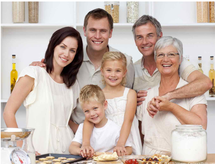
Implantate sind ab 18 Jahren bis in's hohe Alter möglich. Sie geben Sicherheit beim Reden und Lachen und sie ermöglichen es, wie mit eigenen Zähnen zu beißen und zu kauen.

Wenn die Nachbarzähne schon sehr stark gefüllt oder geschädigt sind, kann es besser sein, eine Brücke zu machen. Durch die Kronen werden die Zähne stabilisiert, so dass sie länger halten können.