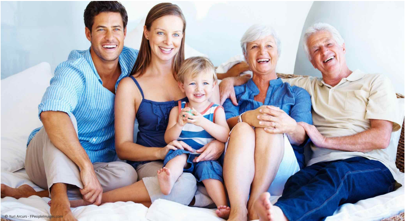
So macht das Leben wieder richtig Spaß: Mit komplett festsitzenden Zähnen essen, reden, lachen und sich im Kreis der Familie wohlfühlen.

Wie Sie wieder komplett fest sitzende Zähne statt Totalprothesen haben können