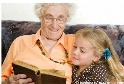
Mit Implantaten müssen Sie nicht mehr damit rechnen, dass sich die Prothese beim Sprechen oder Vorlesen löst. Damit können Zähne gemacht werden, die so fest halten wie eigene.

Nach einer Untersuchung Ihrer Kiefer können wir Ihnen genau sagen, wie viele Implantate in Ihrem Fall sinnvoll