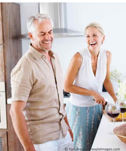
Mit fest sitzenden Zähnen kann man sich wieder jünger fühlen und das Leben aktiver genießen.

Wenn Ihnen schlecht sitzende Prothesen das Leben schwer machen: