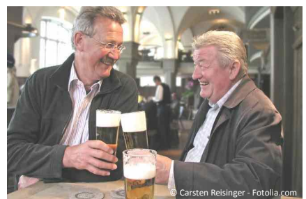
Sicherheit im Umgang mit anderen: Zähne mit Implantaten halten fest und ermöglichen unbefangenes Reden und Lachen in jeder Situation - auch beim Bier mit Freunden.

So kann mit relativ wenig Implantaten eine fast komplette Zahnreihe mit fest sitzenden Zähnen gestaltet werden.